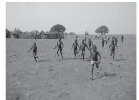
DAMIT SIE EINE ZUKUNFT HABEN

Damit das Recht auf Nahrung wahrgenommen werden kann, braucht es nach wir vor die Unterstützung von Initiativen, in denen von Hunger und Armut Bedrohte sich in Angriff nehmen möchten, um ihre Situation zu verändern, soweit das in ihrer Macht steht.