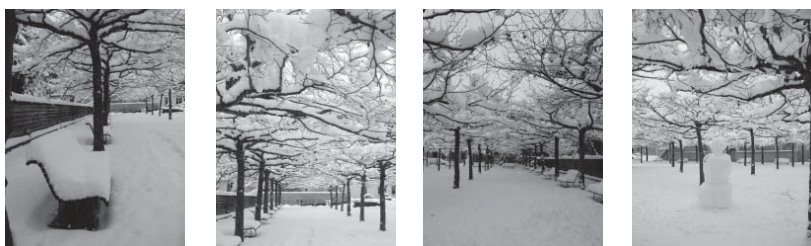
BILDER: IMPRESSIONEN VOM PLATANENHOF, JANUAR 2009

An Ostern 2009 kann die Kirchgemeinde Paulus ihre neue Orgel in Betrieb nehmen. Mit einer Festwoche und einem Orgel-Jahr feiern wir diesen Anlass. Näheres siehe www.pauluskirche.ch/1797.html