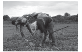
Arbeiten für den eigenen Lebensunterhalt statt für den Reichtum anderer.

In Brasilien gibt es ein Projekt des HEKS (Hilfswerk der Evangelischen Kirchen der Schweiz), das genau hier ansetzt: Landlose, denen die Möglichkeiten ihre traditionellen Landwirtschaft durch Landraub entzogen werden, tun sich zusammen. Sie kämpfen dafür, wieder Land zu bekommen, von dem sie leben können. Sie bauen Handelswege auf, um ihre fair produzierten Produkte auf dem heimischen Markt zu verkaufen. Im Rahmen des Projektes entwickeln sie so Alternativen zu den entmündigenden und entrechtenden Verhältnissen, die ihnen von den bestehenden unfairen Wirtschaftsstrukturen aufgezwungen werden.